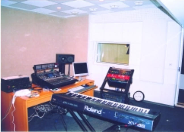
Общий вид акустической звукозаписи Игоря Павленко.

бороться, но уже и оборудование установлено, и работу приходится приостанавливать, и в результате все обходится дороже, причем правильно все равно уже не получается. Это же относится к верному и своевременному выбору системы кондиционирования и вентиляции. Расчет внутренней акустики определяется прежде всего временем реверберации, которое, в свою очередь, зависит от задач студии. Для записи речи время реверберации одно, для записи музыкальных инструментов или вокала другое. Для аппаратной требования особые, там время реверберации во всем диапазоне частот должно быть 0,3 с. Одновременно с этим делается экономический расчет, и даже при небольшом бюджете выбираются материалы недорогие, но обязательно отвечающие требованиям звукоизоляции и звукопоглощения, причем все акустические материалы мы обязательно испытываем, потому что рекламные данные – это одно, а реальность, увы, другое. После всех согласований начинается само строительство, которое, естественно, постоянно нами контролируется и, уже когда 90 процентов работ закончены, начинается акустическая настройка, в процессе которой происходит тонкая доводка и устранение изъянов, которые невозможно было определить на ранних стадиях строительства”.